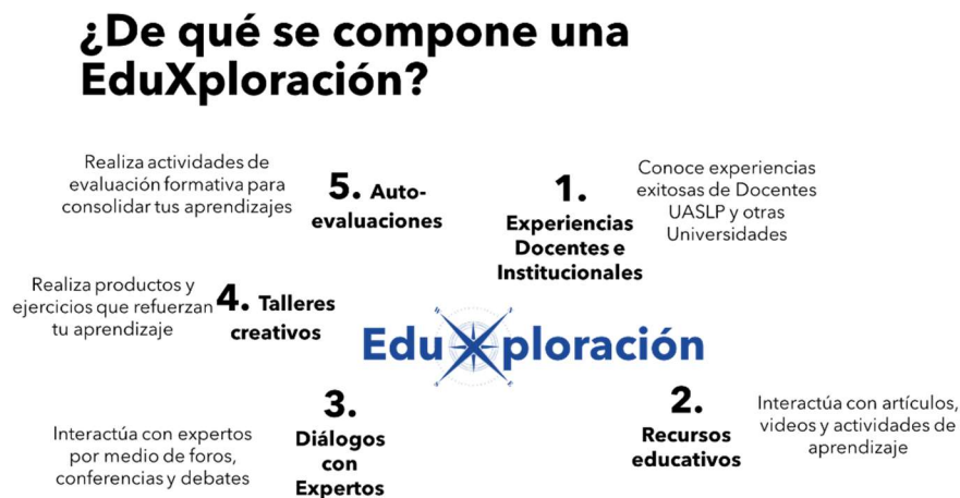
Figura 1. EduXploración: elementos.

En la Figura 2 se coloca un ejemplo de un EduXplora sobre “Aula Invertida”. Como puede observarse, la duración de un EduXplora puede variar en función de los diversos elementos que integre.